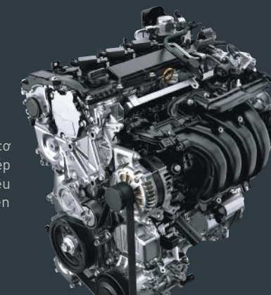
Động cơ 2ZR-FXE

Được thiết kế dành riêng cho Hybrid, động cơ 1.8 lít với hệ thống điều phối van biến thiên kép Dual VVT-i và chu trình Atkinson đem lại hiệu quả tối ưu, tiết kiệm nhiên liệu và thân thiện với môi trường.